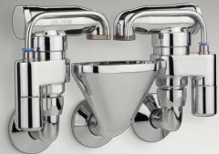
Automatisches Strangspülmodul WimTec® PROOF AS

Alle Sanitärösungen von WimTec® unter www.wimtec.de